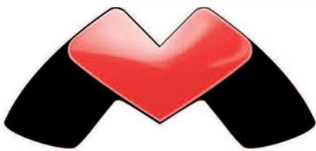
Clubblad MSX Vriendenclub Marienberg